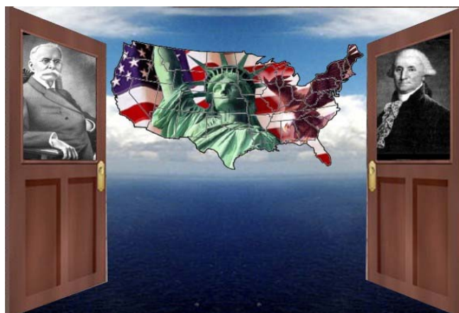
Centro de Recursos Informativos Amador Washington

Estas obras pueden ser consultadas en el Centro de Recursos Informativos Amador Washington ubicado en el Edificio Clayton, Clayton (antiguo Edificio 520) Teléfono: 227-7100 / Fax: 207-7363